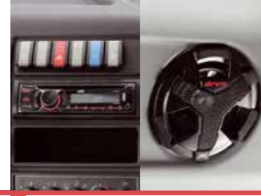
Özel Müzik & Ses Sistemi*