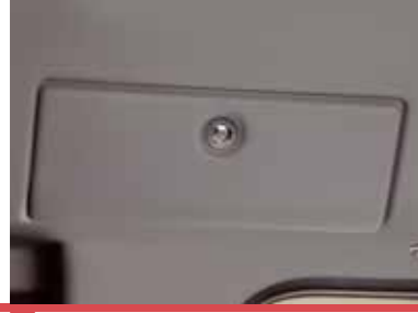
Başüstü Eşya Saklama Dolabı