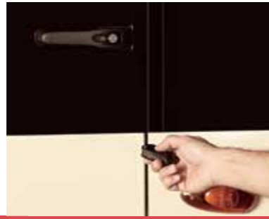
Uzaktan Kumandalı Merkezi Kilit Sistemi