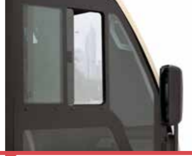
Açılır Sağ Ön Yolcu Camı