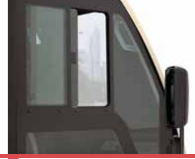
Açılır Sağ Ön Yolcu Camı