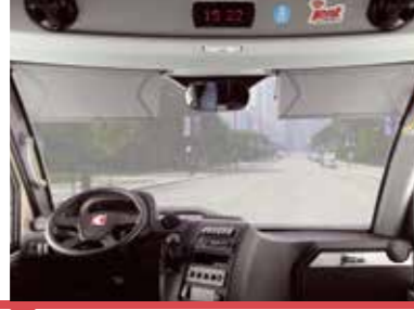
Sürücü & Yolcu Tarafında Güneşlik*