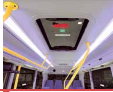
Yolcu Bölümü Aydınlatması (Tavan Işık Yolu)*