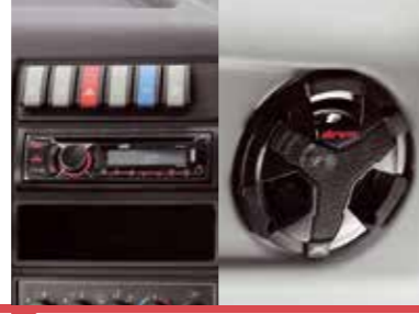
Özel Müzik & Ses Sistemi*