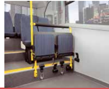
Yükseltilmiş Koltuk Kapasitesi (11+4+6+1 Sınıf A & 11+4+1 Sınıf B)