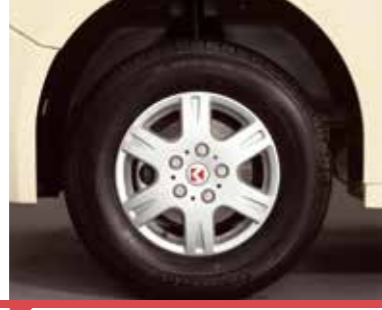
Alüminyum Alaşımli Jantlar*