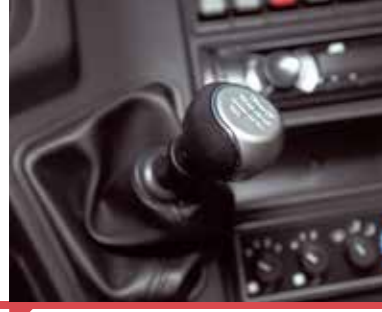
Modern Tasarımlı Vites Topuzu*