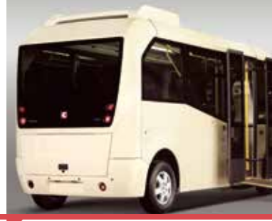
Koyu Renkli (Galaxy) Camlar*